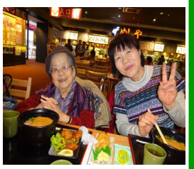
お嫁さんとご参加