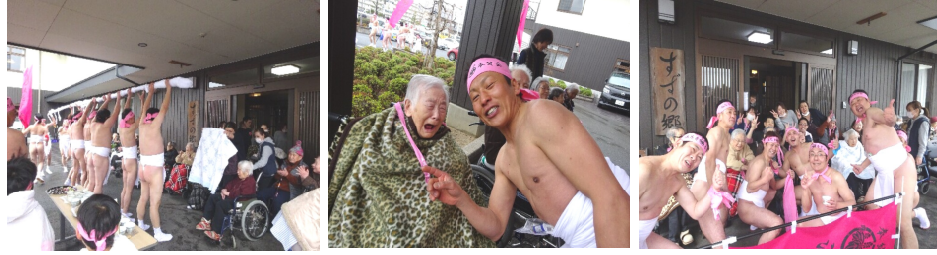
思わず見とれてしまう

「ワッショイ！ワッショイ！」と勇ましく現れた裸男達に、お年寄り達は盛大な拍手で迎えるやいなや、大きな声で「ワッショイ！」と掛け合います。そして裸男から「なおい布」を裂いた厄除けのお守りをもらうと、思わず涙されたり、早速手首に付けられたり、握手や写真を撮ったり。裸になれないお年寄りの代わりとなって、すずの郷の「なおい笹」も担いで神社へと歩いていく裸男達の後ろ姿に「お願いします」と手を合わせ見送ってみえました。（鈴木夏由子）