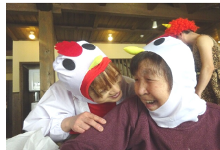
よし子さんも楽しそう