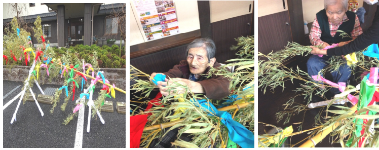
全入居者さんの願いを書いたなおい布をみんなで飾り付け奉納

尾張地方約1250年の歴史をもつ、壮大なはだか祭り。今年、裸男初来訪！朝からお年寄りの皆さんで、願いを込めて書いた色とりどりの「なおい布」を竹笹に結びつけ、祭りの準備。お昼すぎ、小雨で寒い中でも、大勢のお年寄りがワクワクしながら、裸男達の到着を待ちました。