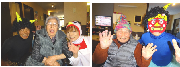
鬼と一緒に記念撮影

春に向けて各ユニットでは恒例のお花見を計画中です。1Fフロアは、合同で3月31日に下水道科学館の公園にて七宝亀甲は3月23日に稲沢公園にて矢絣千鳥は4月4日に桜を車窓見学しながら皆で海津温泉へ西館は、随時少人数制でお花見の予定です。すずの郷では今年も季節のイベントを大切に盛り上げていきたいと思っております。（浜嶋いづみ）